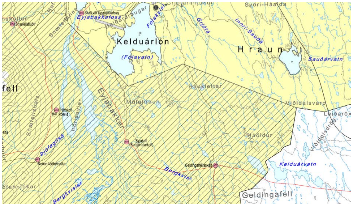
Mynd 2 Mynd af svæðinu úr aðalskipulagi Fljótsdalshrepps 2014-2030 skipulagssvæði auðkennt AF-7