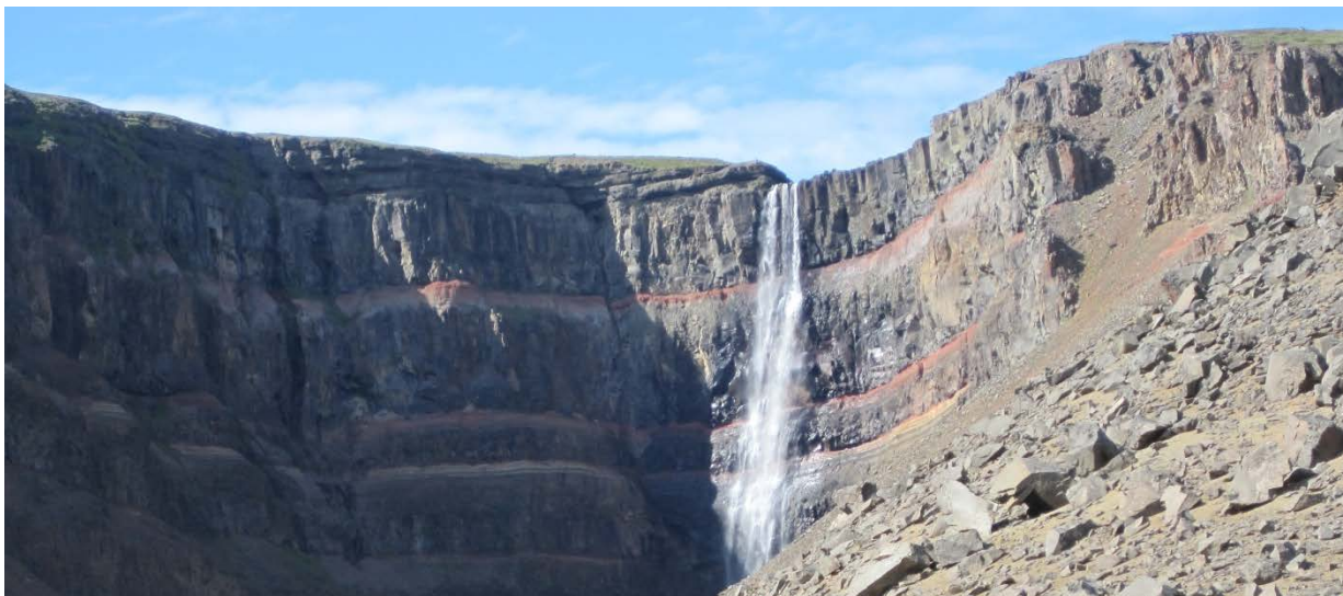
Mynd 2 Hengifoss