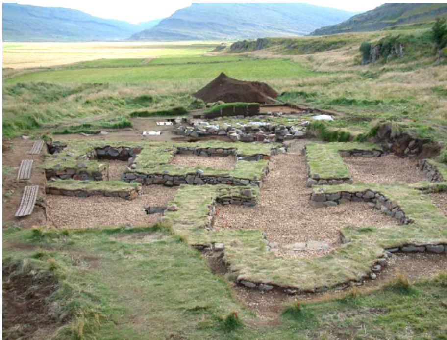
Mynd 2 – Endurgerð rústanna af Skriðuklaustri

Að loknum uppgreftri sumarið 2005 var grunnform Skriðuklausturs endurbyggt. Tíu manna hópur vann verkið í samráði við Fornleifavernd ríkisins (Steinunn Kristjánsdóttir 2006b). Hópurinn sem vann verkið kom víða að og hafði því margt fram að færa, allt frá sköpunargleði til vísinda. Fyrst var byrjað á að hreinsa allt illgresi af svæðinu. Eftir það voru tveir bændur af svæðinu fengnir til að sýna hvernig ætti að raða steinum og leggja torf í veggina. Hópurinn var í tvær vikur á svæðinu við byggð rústanna (Abigail, 2005). Nú er hægt að ganga um herbergjaskipan rústanna sem sjást hér fyrir neðan.