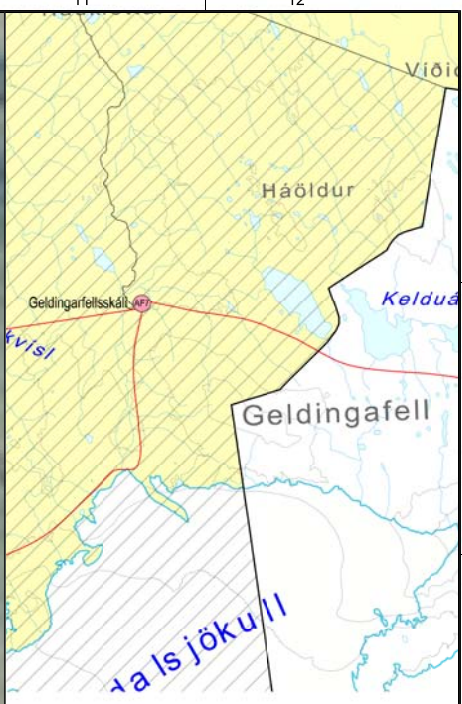
Hluti af Aðalskipulagi Fljótsdalshrepps 2014 - 2030. Deiliskipulagsvæði er merkt AF7 á myndinni.